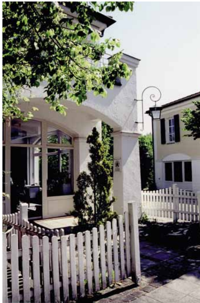
Akademie für Homöopathie in Gauting bei München